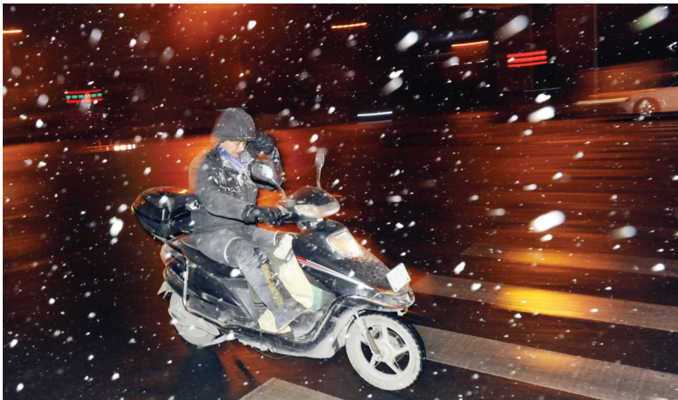
昨晚,合肥市民冒雪回家