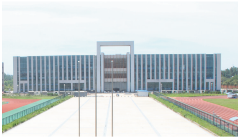
安徽体育运动职业技术学院