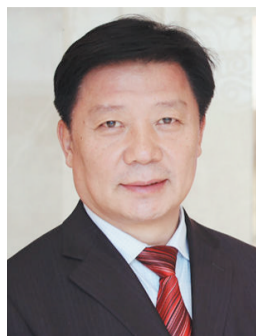
全国优秀县委书记 李树起升任天津副市长

昨天上午,天津市第十六届人大常委会举行第二十三次会议。会议决定任命李树起为天津市副市长。2015年,李树起被中组部授予全国优秀县委书记称号。他曾担任宁河县县委书记。 据《天津日报》