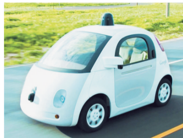
谷歌无人驾驶汽车

据美国IHS咨询公司统计,IS平均每月收入8千万美元。近来美国和俄罗斯加大了对石油设施的空袭,该组织的石油交易受到一定影响,收入可能有所减少。IS大约一半的收入来自勒索、抢劫和绑架赎金,43%的收入来自石油走私,其余来自贩毒和国外私人捐赠。