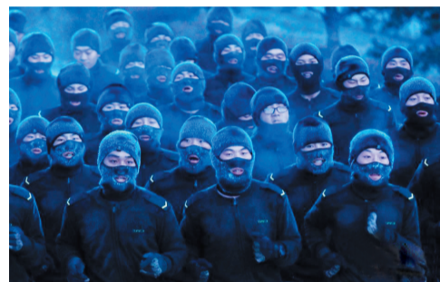
百名新兵严寒中训练,如“兵马俑”兵团

11月29日,黑龙江省军区某边防团百余名“95后”新兵冒着零下20余度严寒气温进行训练,战士们们的帽子、绒衣外形成了一层厚厚的“冰铠甲”,犹如“兵马俑”兵团来袭。 据中新社