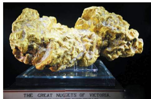
中国国际珠宝展,世界最大自然金亮相

11月29日,黑龙江省军区某边防团百余名“95后”新兵冒着零下20余度严寒气温进行训练,战士们们的帽子、绒衣外形成了一层厚厚的“冰铠甲”,犹如“兵马俑”兵团来袭。 据中新社