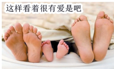
但实际情况绝逼是这样的!