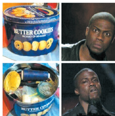
我以为在我奶奶家找到了零食