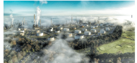
《烟雾弥漫的炼油厂上空》 拍摄于英国福利港口,阳光下的朦胧美。

11月18日,中国首届无人机摄影大赛在深圳高交会大运中心分会场举行了颁奖礼,公布了所有获奖照片。以下是获奖的两张图片。 星报综合