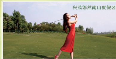
兴茂悠然南山度假区