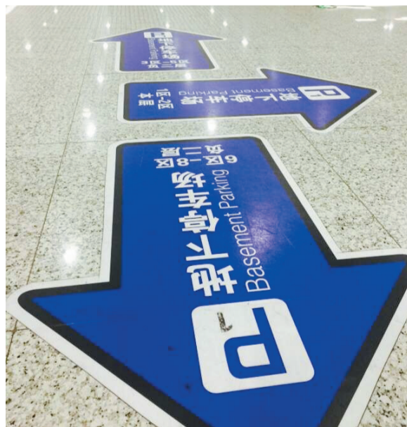
南站的各种标志都焕然一新