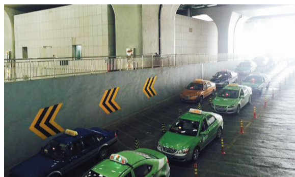
大量出租车进入蓄车区等候乘客到来