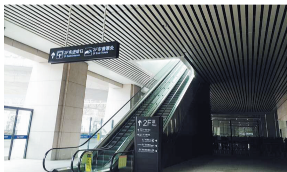
连接落客平台和北广场的自动扶梯已投入使用