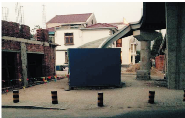
人行道下桥口离机动车道很近