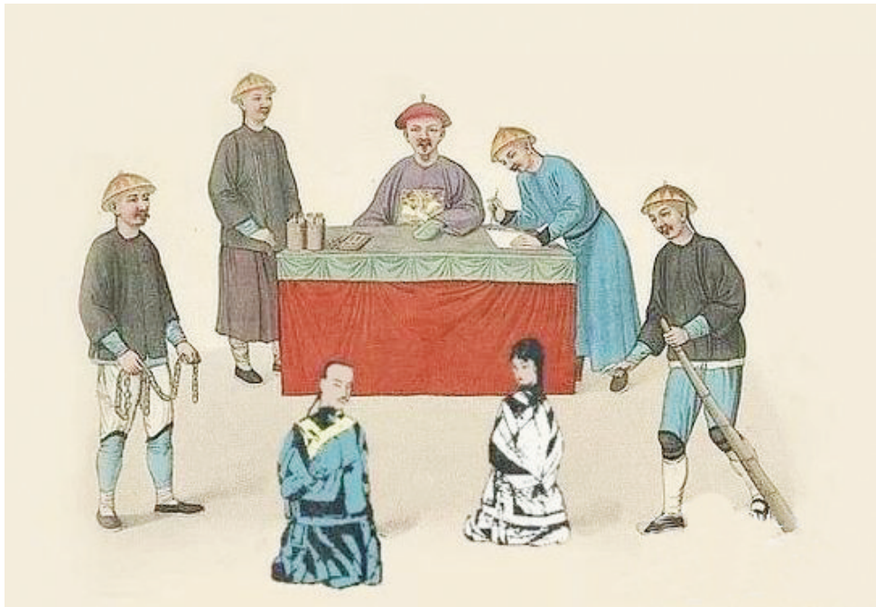
杨乃武与小白菜是清末四大疑案之一