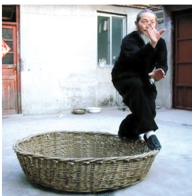
最强平衡木,人在飘吗?