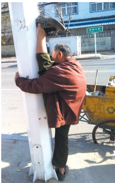
一字马的清洁工大爷