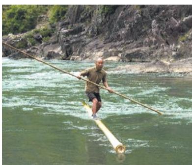
大爷,你这是平衡木+水上漂啊