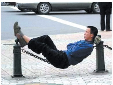
睡绳子改睡铁链子了