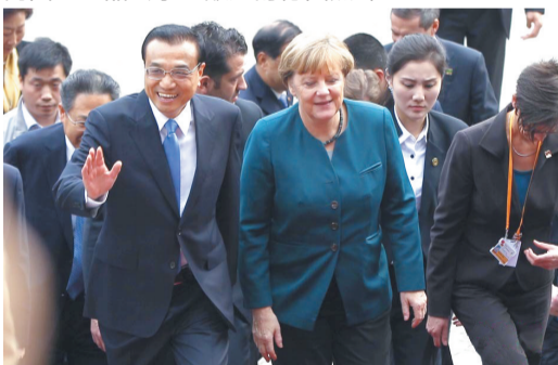
李克强与默克尔在合肥学院内考察