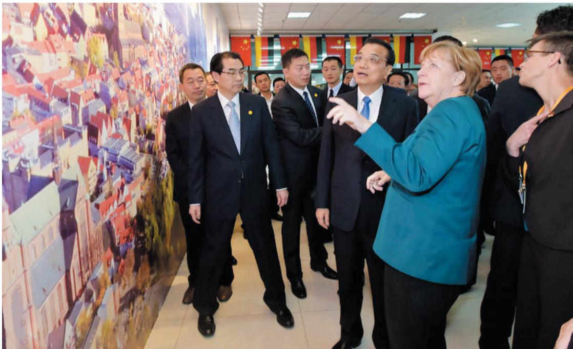
两国总理共同观看合肥学院中德合作30周年图片展