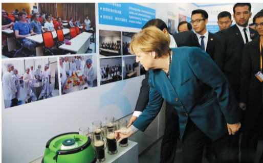
两国总理品尝学生酿造的德国黑啤