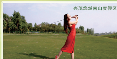
兴茂悠然南山度假区