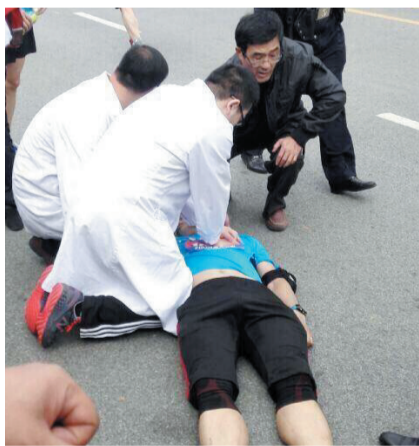
医护人员抢救猝死男子

目前，赛事组委会对该选手的不幸表示沉痛哀悼，及时对家属进行安抚，并将协助有关单位做好善后工作。