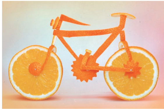
据说到了玩橙子的季节