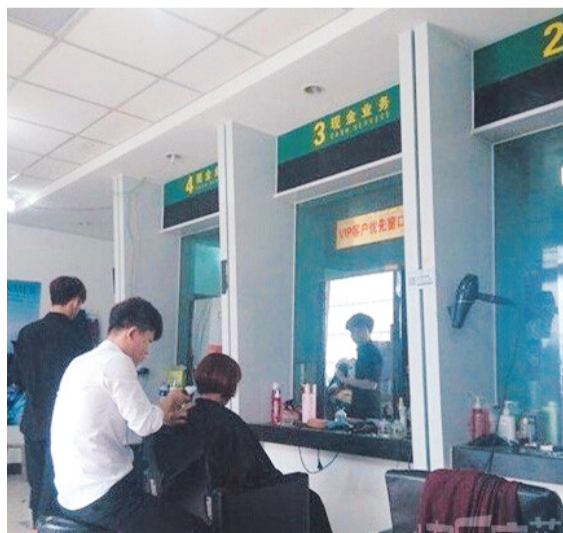
这家理发店成功地吸引了我的注意