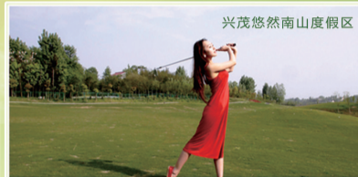
兴茂悠然南山度假区