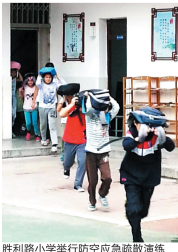
胜利路小学举行防空应急疏散演练