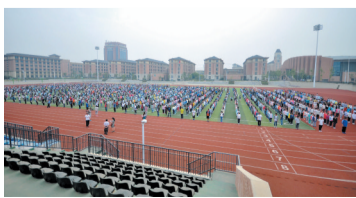
合肥七中新校区举行防空应急疏散演练