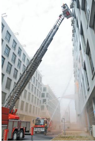
防空应急疏散演练

昨天上午,合肥多个学校举行了紧急疏散演练。合肥七中新校区举行了以“珍爱和平、热爱生命”为主题的教育活动,并进行了紧急疏散演练。庐阳区逍遥津街道九狮桥社区与合肥市42中联合开展了“珍爱生命,勿忘国耻”为主题的防空紧急疏散活动。胜利路小学举行“九一八”防空应急疏散演练。