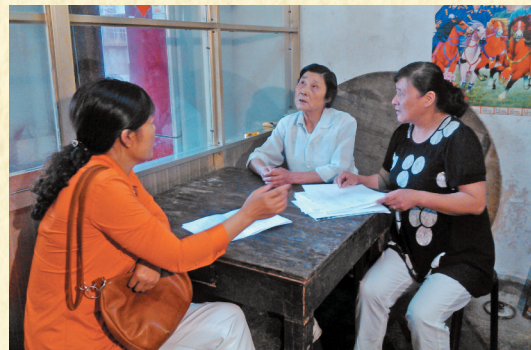
童承英老人陷入对往事的回忆