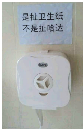
保洁阿姨也是段子手……