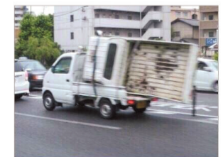
都让开路！ 我朋友快不行了！