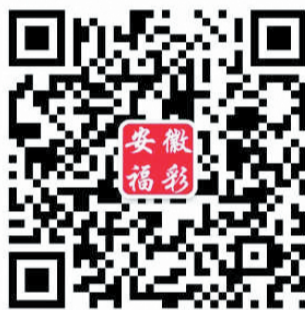
安徽福彩官方微信

关注安徽福彩微信,转发快3加奖,赢中国最美高铁线合福高铁双人游,彩民朋友,你准备好了吗? 盛文