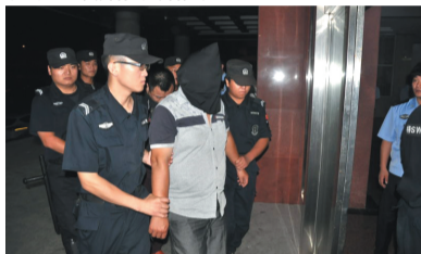
嫌疑人被带离现场