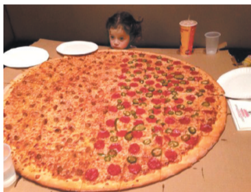
一小孩想吃披萨，她妈问她想要几寸的，女儿坚持要店里最大的那种，于是……