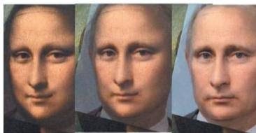
感觉发现了个秘密……