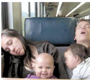
拍照的时候记得笑