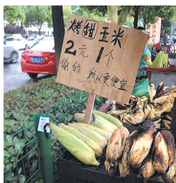
街头小贩的广告已经逆天了