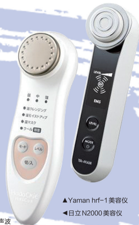
▲Yaman hrf-1 美容仪