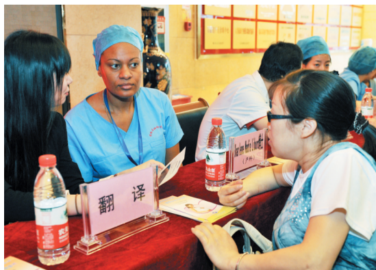
美国产科专家为市民义诊