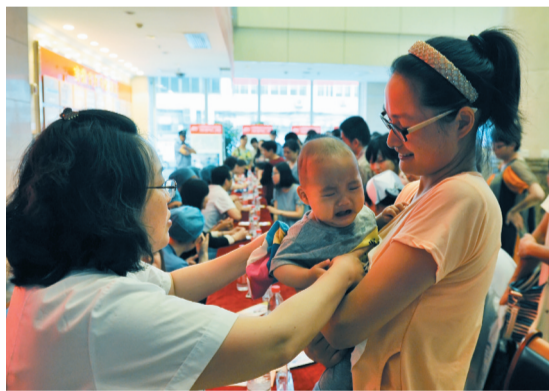
妇儿科专家为婴幼儿义诊