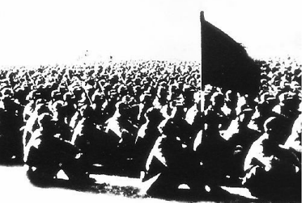
新四军部队在进行战略反攻动员