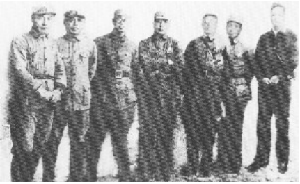
新四军军部成立时合影。左起：陈毅、项英、袁国平、李一氓、朱克靖、粟裕、叶挺