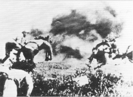
战斗中的新四军第七师指战员