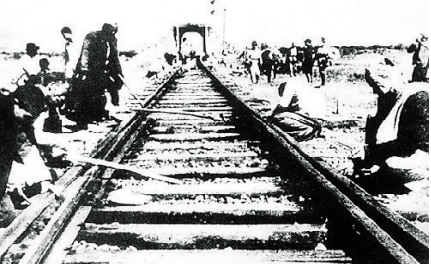
1945年秋，新四军破击津浦路徐州、固镇段。图为当地群众参加破坏铁路情形