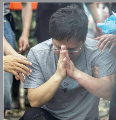
遇难人员家属哀悼亲人

昨天是“东方之星”客轮长江倾覆事故遇难者“头七”祭奠日，遇难者家属及前方指挥部在沉船搜救现场举行悼念活动，上午9时，遇难者家属、救援人员、当地群众、媒体代表1000余人的哀悼队伍集结在位于事发地长江北岸的堤坝上，搜救船只的甲板上，静静伫立、默哀。 9:00 哀悼活动开始。 9:03 岸上救援人员，浮吊上的救援人员肃穆而立，时间仿佛在此刻静止。 9:09 随着交通部长杨传堂一声“请默哀”，所有人低头哀悼，江面响起汽笛声为逝者送行。 现场所有人员面向遇难船舶肃立默哀3分钟，船舶同时鸣笛3分钟，沉痛哀悼遇难者。 愿逝者安息，生者坚强。