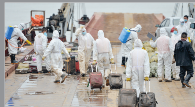
搜救人员将遇难者遗物转运出舱