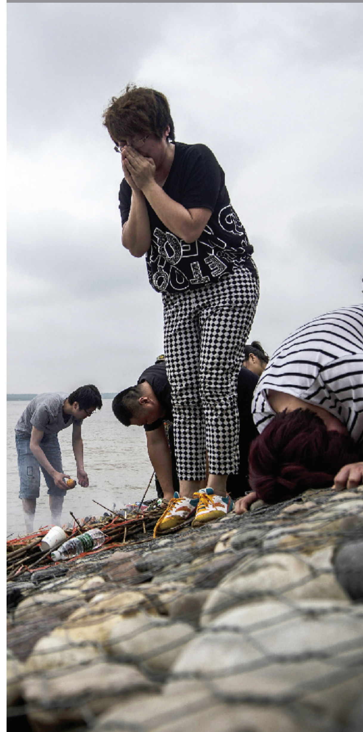
遇难人员家属在长江边哀悼亲人