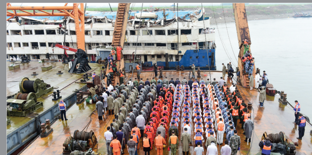
救援现场举行哀悼遇难者活动