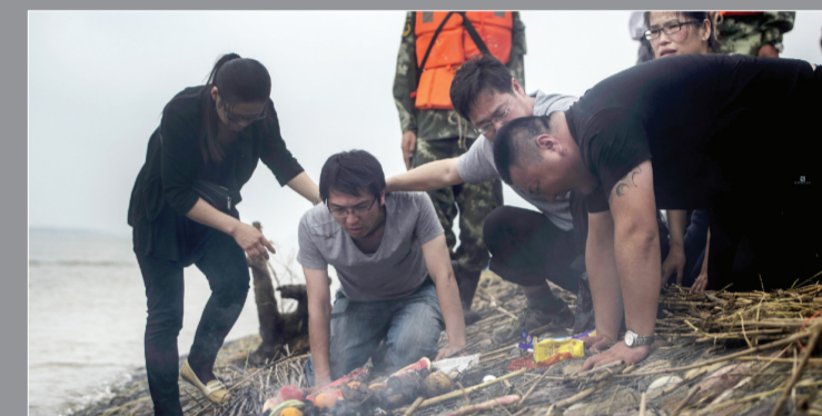
遇难人员家属哀悼亲人