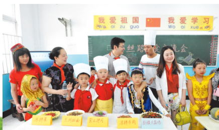
亲手制作“丝路”美食