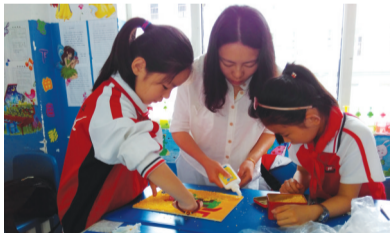
亲子“丝路”创意版画制作