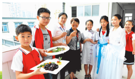
在学校,与校长和老师一起品茶,尝美食