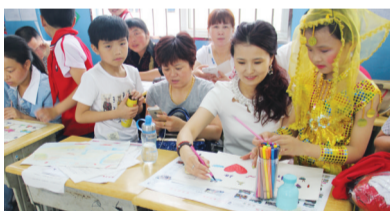
孩子和家长一起做手抄报

不断打造并形成品牌活动课程,这也正是光华学校的特色所在。据悉,光华学校新一轮素质教育改革的研究与实验已经启动,我们期待光华的孩子们有更多的精彩、更好地成长!