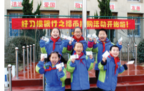
好习惯银行发行福币

防护标志和符号……这些在大人们看来都要挠头的难题,但是对于芙蓉小学的孩子们来说,“那都不是事儿”。这得益于芙蓉小学“三生教育”中的生存教育。