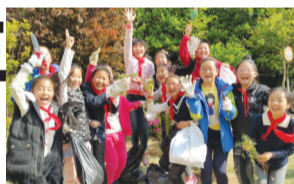
保护地球日拔草行动

如果在户外意外受伤怎么办?如果独自在家遇到危险怎么办?如果发生火灾怎么办?如果碰到坏人抢劫怎么办?如果地震了又该如何逃生?溺水、车祸、拐卖、识别安全