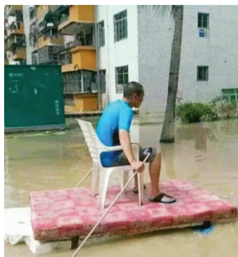
大哥您的心态也是蛮淡定的