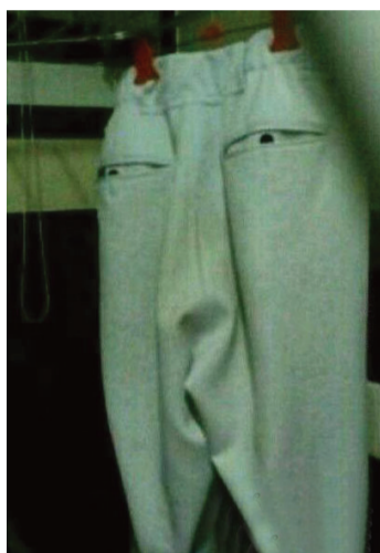
被一条裤子给嘲讽了