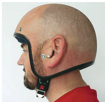
新买的头盔，不错吧