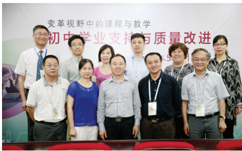
南园学校分会场与会专家合影

整个活动期间,共举办了专家与校长的主题报告、学校文化展示、互动交流等多个环节,除了与会代表共同探讨变革下的课程与教学之外,还分享了基础教育专家的办学经验与智慧。本次论坛吸引了来自北京、上海、湖北、广东等诸多省市的学者、校长以及教师300余人前来参会。