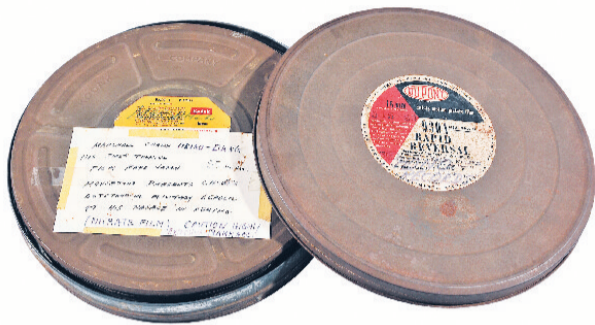
▲张学良罕见的英语电影新闻纪录片胶片，至今仍能播放。在纪录片中，张学良痛斥日军侵略中国。纪录片还航拍了北京城。