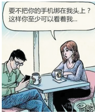
手机对我们生活的影响……