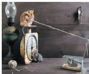
这么高的智商，当猫可惜了