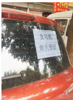
这几天开车，大家都离我远远的