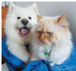
跟一个二货拍照是怎样一种体验