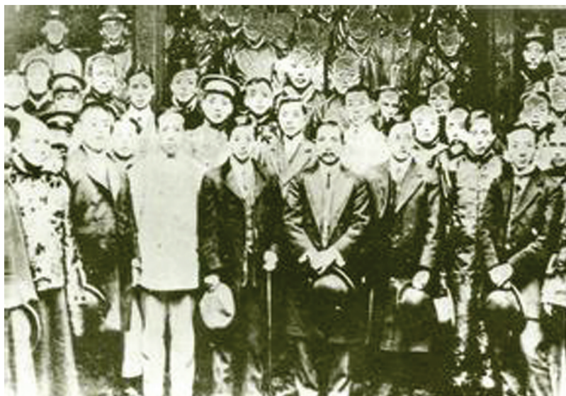
孙中山视察芜湖时在广东会馆演讲

1948年，来龙里广东会馆曾作为江广米行会所，欲重振米市雄风，再作龙头，惜志未遂。后来，成了居民大杂院。