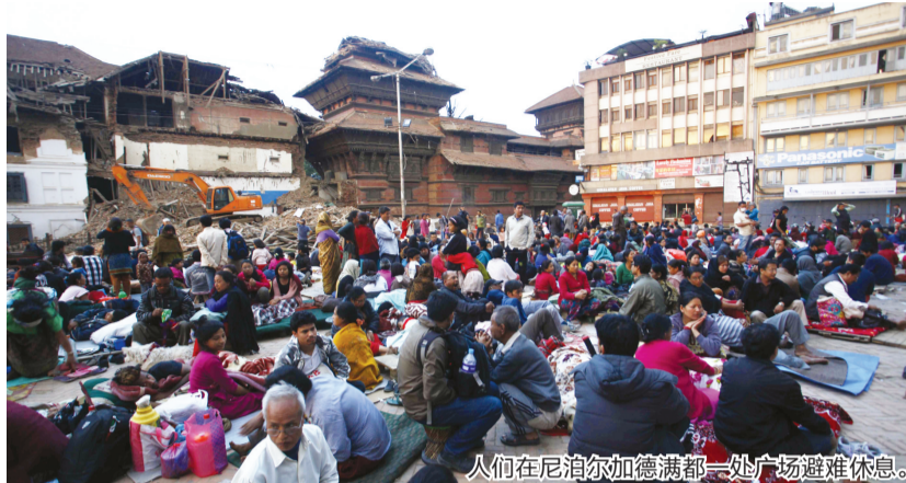
人们在尼泊尔加德满都一处广场避难休息。