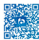
扫一扫,登陆移动官网