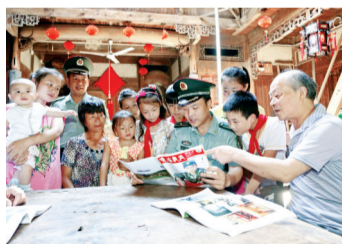
驻宣部队官兵结对助学