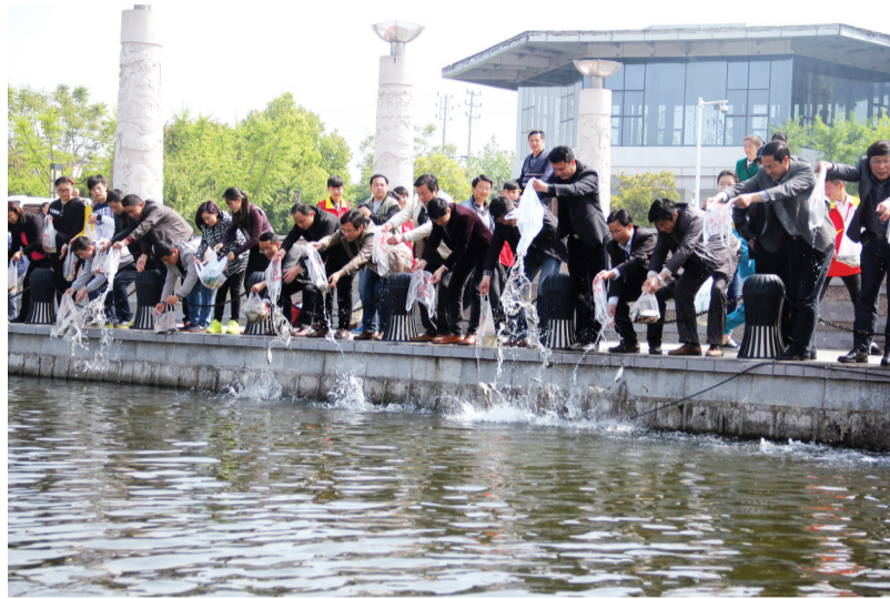
4月22日,在当涂县护城河龙舟文化广场放养点,10万尾鱼苗被放进了当涂县护城河水域。当涂县护城河开凿于三国黄武年间,距今已有1700多年的历史。目前保存的护城河全长5.3公里,水面宽约100米,呈“U”字形环绕城区,宛如一串璀璨的项链。从2009年开始,该县先后投资36.8亿元,对护城河环境进行综合整治,水质逐年改善,重现清波。