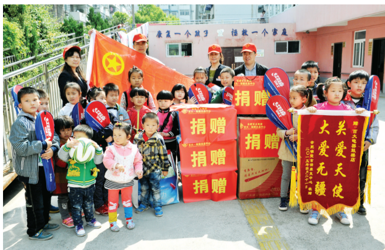
昨日,百大电器鼓楼店志愿者一行前往合肥锦雯言语康复中心,看望残缺的天使。向残障儿童捐赠了几千元的儿童适用品和体育用品,用爱心构筑和谐,让天使不流泪“携手圆梦”,共同筑起爱的“长城”。 记者 倪路/图

预计该县74.1万亩年耕地底前可基本完成确权登记颁证工作,为农户承包地换上新版承包双方信息、承包地块详细情况的“二代身份证”。有了新版的农村土地经营权证,农户就可以向银行申请抵押贷款,解决生产旺季资金不足问题。