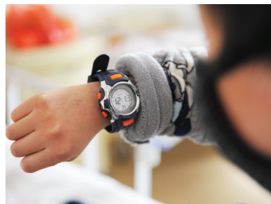
好心人送来的手表小明浩看个不停

“感谢合肥市民和社会上爱心人士的帮助和市场星报关注，以及各网友的爱心，我和我的家人非常的感谢。”在感谢信的末尾，父子俩签上了各自的名字。