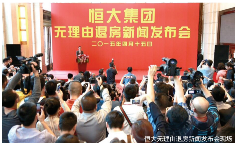
恒大无理由退房新闻发布会现场

以往当购房者提出退房的时候，往往会受到开发商的种种抵制，但现今开发商主动提起“无理由退房”的促销政策，不禁让购房者受宠若惊，而谁家又是如此任性的房企？