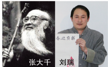
张大千是中国近代书画泰斗，被誉为画荷皇帝，与他的山水人物画一样，荷画是他的另一座艺术高峰。2012年5月《荷花鸳鸯》在香港拍出了2450万美元的天价。

国家一级美术师，中国美术家协会会员，齐白石再传弟子的《瑞桃献寿》取材于中国古老贺寿文化。 桃被视为长寿的象征，被誉为万寿果，千岁之寿。画作只撷取桃树的局部绘制六只寿桃，寓意六十大寿，六六大顺之意，用笔凝练遒劲，精妙绝伦。被当代著名书画家评价为：“此桃丝毫不逊色于齐白石大师的风格”。同类题材的作品，多藏于博物馆之中，值得藏家珍藏。