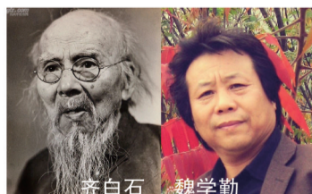
齐白石，中国近代绘画泰斗。齐派桃是最典型的红花墨叶派立宗的代表，他的作品中，桃子和蟹子的价格也是最高。齐白石力作《荷花各三千年》以3450万元创造了寿桃题材单件作品最高纪录。