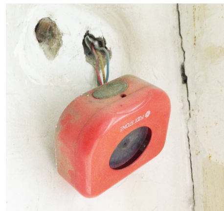
消防报警器遭破坏