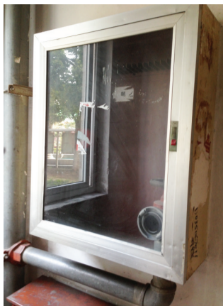
消防箱里空荡荡, 没有任何设备