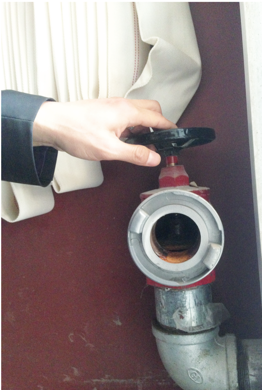
消防栓阀门打开后, 没有流出一滴水