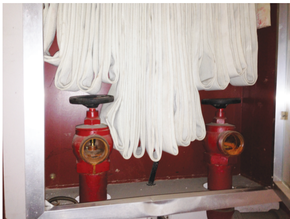
消防箱里只有水带, 缺失接头、喷头