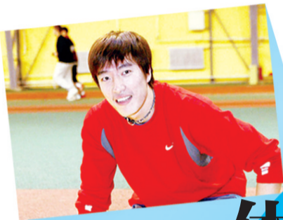
刘翔不说再见 粉与黑完全搞不清

很多网友说，也许，下一次爱上刘翔的时候，是他大胆说出“110米栏再见”的时刻，天下没有不散的宴席，换一个角色开启新的一段人生旅途，是刘翔及其粉丝们最渴望的事。