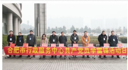
合肥市政务服务中心房产局窗口: 五星服务,温馨窗口

亲切的微笑、耐心的指点、热情的服务,以及办事大厅里免费提供的纸、笔、胶水、剪刀、印泥、老花镜等让来此办事的群众深感有家的温暖。“公开公正、依法办事、热情服务、廉洁高效”是他们的工作原则,群众的满意是他们最大的收获。