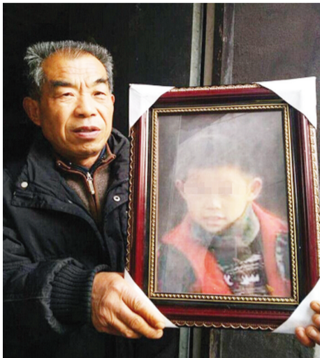
爷爷捧着孩子生前的照片