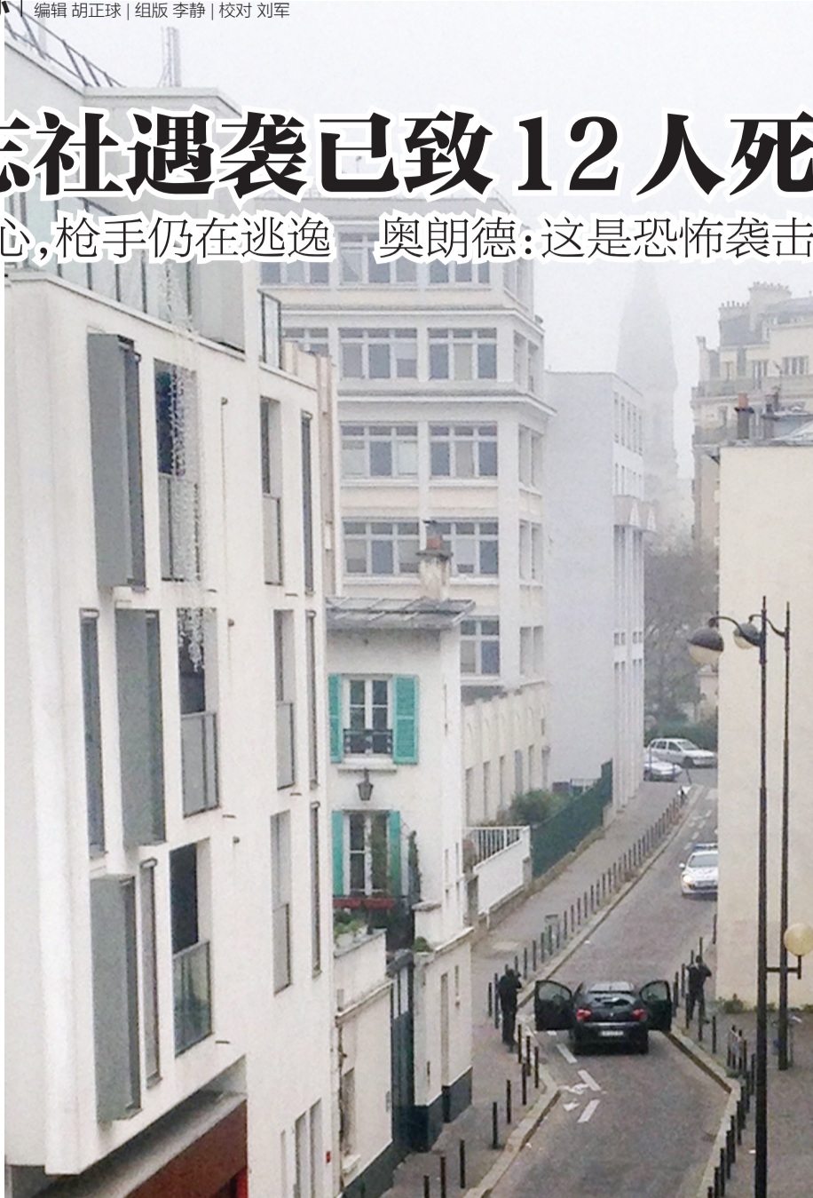
武装分子在《查理周刊》总部附近与警方对峙

位于法国巴黎的《查理周刊》总部7日发生枪击事件,造成至少12人死亡,包括2名警察,另有多人受伤。