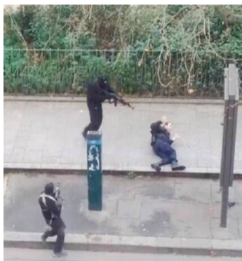
网上的枪杀警察图