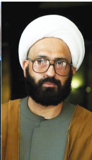
媒体公布的莫尼斯照片

当地时间15日上午9时30分,澳大利亚第一大城市悉尼市中心一家咖啡馆发生劫持人质事件,警方即刻封锁现场,被劫持的悉尼咖啡馆传出枪响,已有两人丧生多人受伤。警方称,咖啡馆内被劫持的人质不到30人。