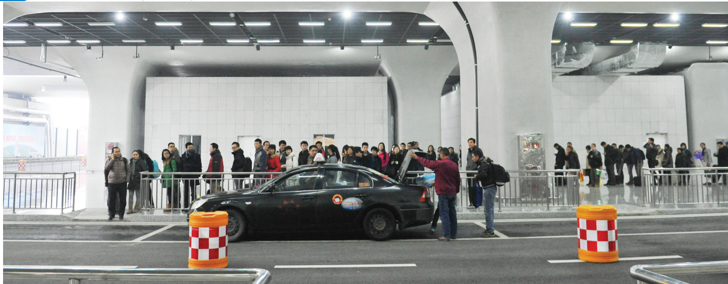
合肥南站出租车等候区车少人多,打车旅客在寒风中排起了长队

12月10日是全国铁路“大调图”的第一天,合肥南站每天运行列车由14趟增至128趟,全部为D或G字头动车组列车,而合肥火车站每天运行列车减少到151趟,主要是普速列车,还有部分动车组列车。南站昨首次迎接大规模客流,能否顺利应对?合肥站人气下降后,会有哪些“连锁反应”?昨日,星报记者来到两个火车站进行了实地探访。