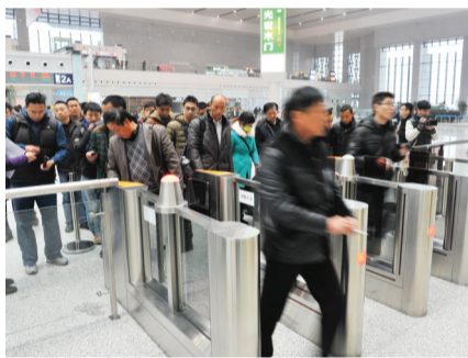
南站检票口,拥挤的旅客排队进站

市场星报记者在现场计时发现,一名旅客从到达出租车候车区,到坐上出租车,一共等了半个小时左右。