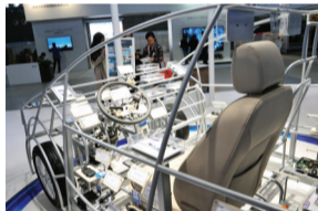
欧姆龙智能座驾模型